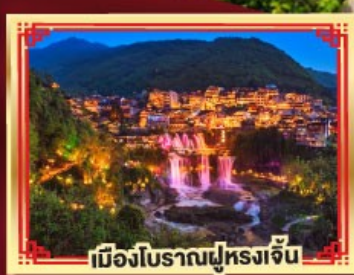
เมืองโบราณฟูหลงจั้น