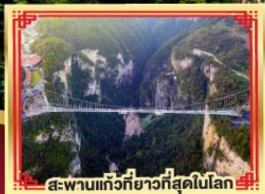
สะพานแกว้ที่ยาวที่สุดในโลก

เขาวงกต เกียนเหมินซาน สองเมืองโบราณ ฟูหลงจั้น เฟิ่งหวง