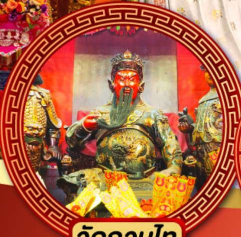
วัดกวนไท