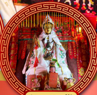
วัดหลินฟ้า