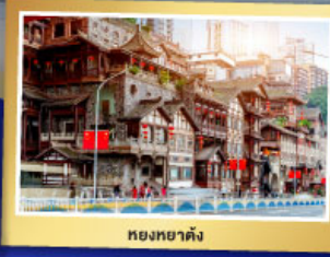
หงหยาดิ่ง