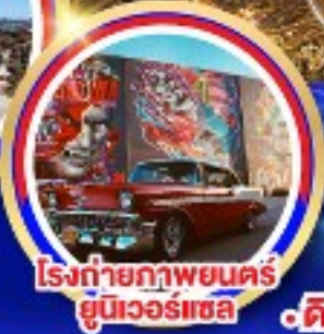
โรงถ่ายภาพยนตร์ ยูนิเวอร์แซล