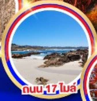
ถนน 17 ไมล์