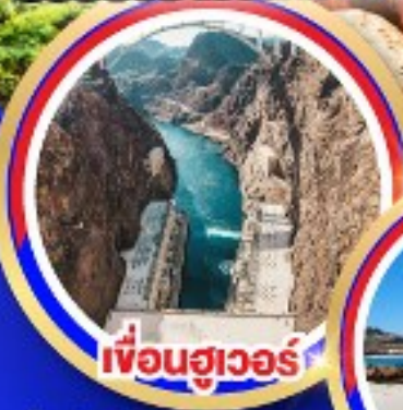
เฟื่องฮูเวอร์

ช้อปปิ้งจุใจเอ้าท์เล็ตออนตารีโอมิลล์ ช้อปปิ้งบาร์สไคว์เอ้าท์เล็ต