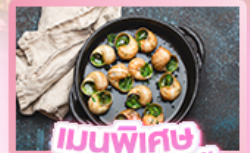
เมนูพิเศษ หอยเอสคาโท

เยอรมัน เนเธอร์แลนด์ เบลเยียม ฝรั่งเศส Keukenhof