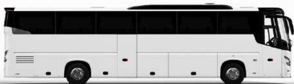
ตัวอย่างรูปภาพรถ 1 ชั้น

ค่าที่พักตามที่ระบุในรายการหรือเทียบเท่าระดับเดียวกัน (พักห้องละ 2 ท่าน) หากประเภทห้องที่ท่านริเคอสมาดูเพิ่มอีก เช่น ริเคอสห้องพักเป็น TWIN BED หรือ DOUBLE BED ทางบริษัทขอสงวนสิทธิ์ในการปรับประเภทห้องพัก เป็นตามที่โรงแรมมีอยู่ โดยไม่ต้องแจ้งให้ทราบล่วงหน้า