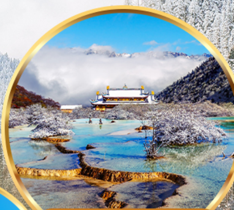
อุทยานหวงหลง