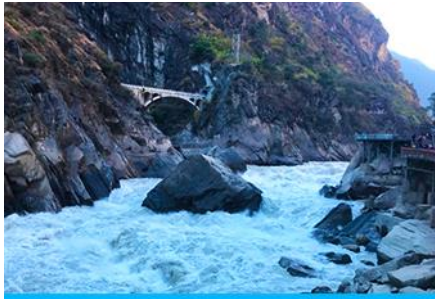
ช่องแคบเสือกระโจน