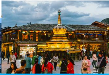
เมืองโบราณแซงกริล่า