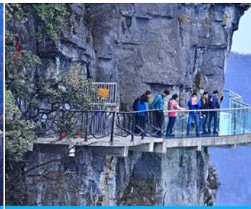
หน้าพลาวยี่ฟ้าทางเดินกระจก