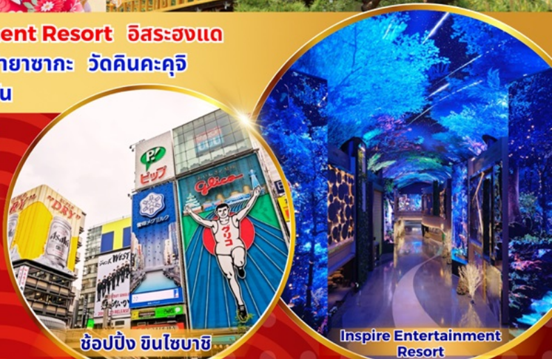
ซูปปิ้ง ซินโซบาชิ