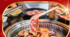
บุฟเฟ่ต์ปิ้งย่าง ไม้วัน

KOREAN AIR บริการอาหารร้อน peach เอนเตอร์เทนเมนท์ฟรี