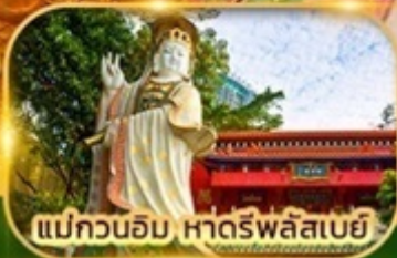
แม่กวนอิม หาดรีพลัสเบย์