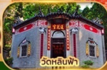
วัดหลินฟา