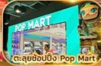
ตะลุยช้อปปิ้ง Pop Mart