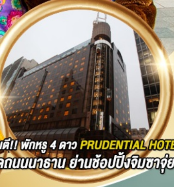
ทำอย่างรสเลิศ