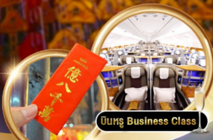
บินหรู Business Class