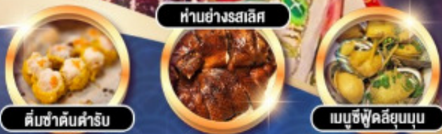
ทำอย่างรสเลิศ