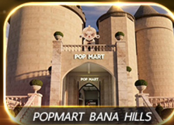
POP MART BANA HILLS

สัมพัสความงามหมู่บ้านฝรั่งเศสที่บานาฮิลล์ ซอปปิง POPMART