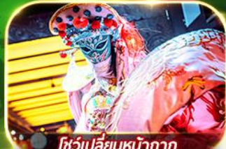
โชว์เปลี่ยนหน้ากาก

สัมผัสความงาม 2 อุทยานแห่งชาติ จิวจ้ายโกวและหวงหลง จัดเต็มช้อปปิ้ง POP MART ศูนย์อนุรักษ์หมีแพนด้า ชมโชว์เปลี่ยนหน้ากาก