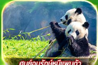
ศูนย์อนุรักษ์หมีแพนด้า