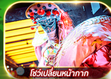
โชว์เปลี่ยนหน้ากาก

สัมผัสความงาม 2 อุทยานแห่งชาติ จิวจ้ายโกวและหวงหลง จัดเต็มช้อปปิ้ง POP MART ศูนย์อนุรักษ์หมีแพนด้า ชมโชว์เปลี่ยนหน้ากาก