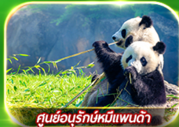
ศูนย์อนุรักษ์หมีแพนด้า