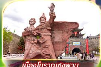
เมืองโบราณซ่งพาน