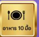
อาหาร 10 มื้อ