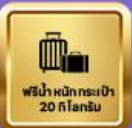
ฟรีนำสัมภาระไป 20 กิโลกรัม