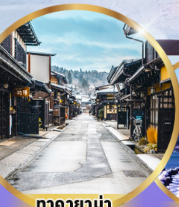
ตากายาม่า