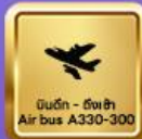
บินดี - ดีต่อใจ Air bus A330-300