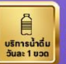
บริการนำดื่ม วันละ 1 ขวด