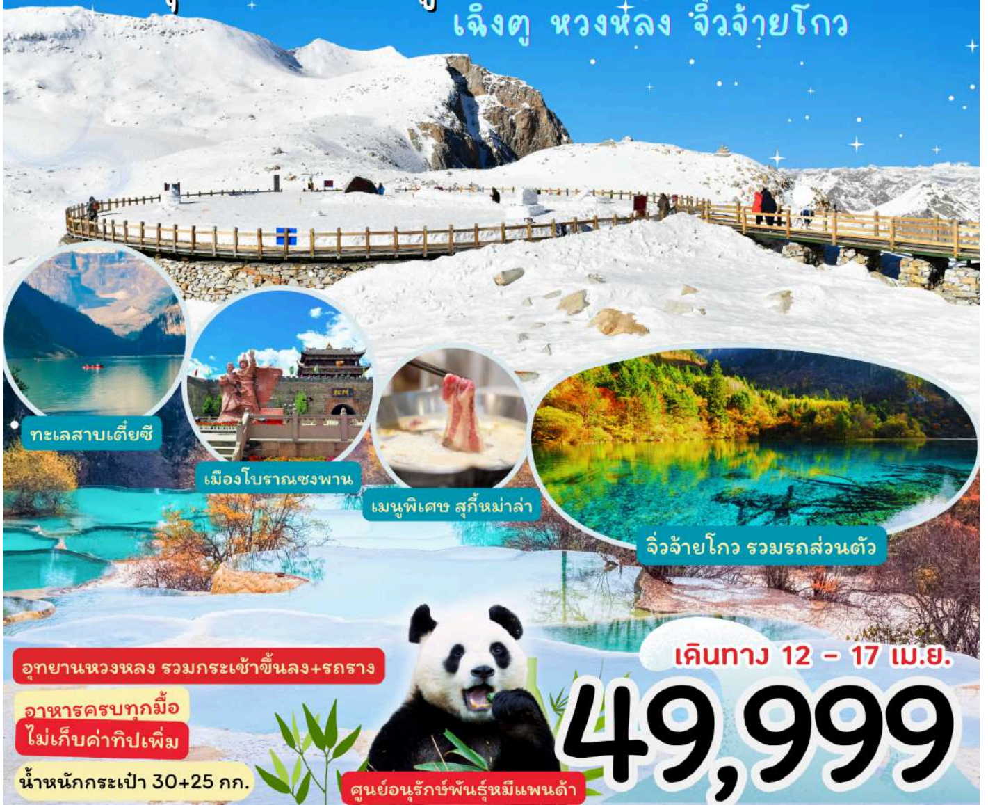
ทะเลสาบเตี๋ยซี