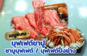
เมนูพิเศษ บุฟเฟ่ต์ข้าว ซาซิมิบุฟเฟ่ต์ / บุฟเฟ่ต์บิงชัง