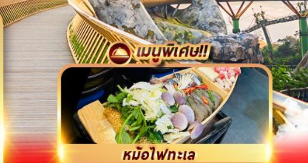
หม้อไฟทะเล