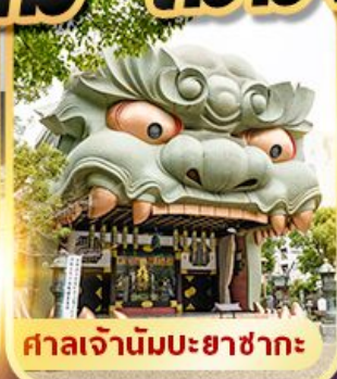
ศาลเจ้านัมมะยาซากะ