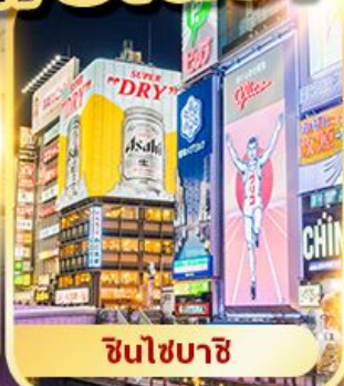
ชินไซบาชิ