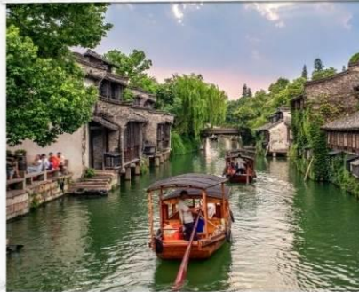
เมืองโบราณอูเจิ้น