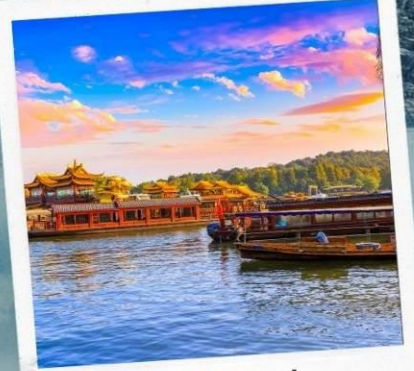
ทะเลสาบซีหู