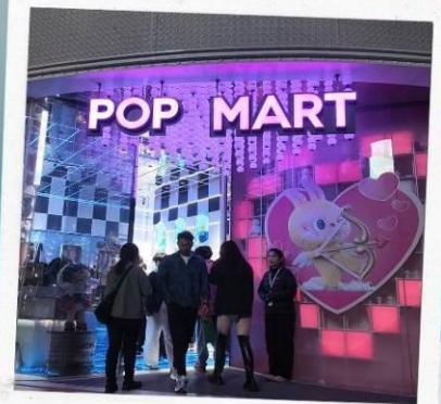
ถนนนานกิง