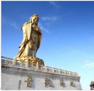
เกาะผู้ไถวซาน