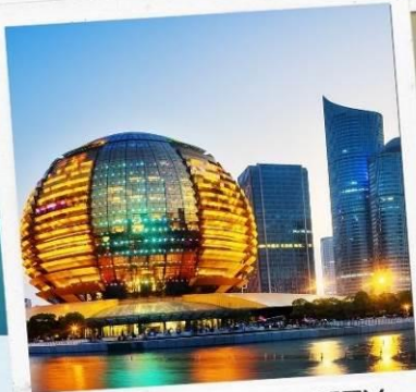
HANGZHOU CITY BALCONY