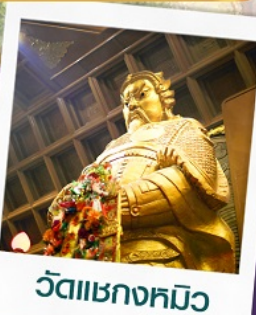
วัดเขาถกหมิว