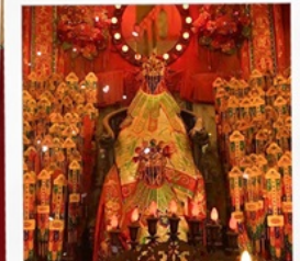
เจ้าแม่กวนอิมวัดสองฮา