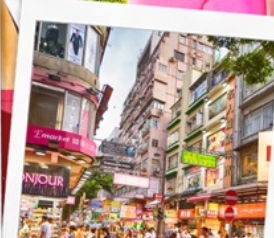
ช้อปปิ้งย่านมงก๊ก