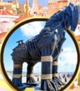
น้ำม้าเมืองทรอย