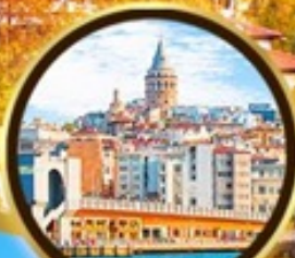
หอคอยกาลาตา