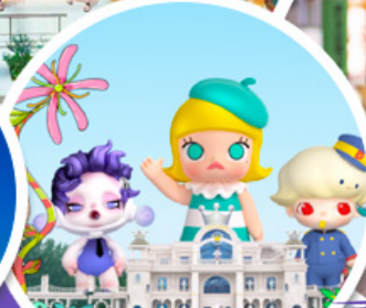
ช้อปบิง POP MART