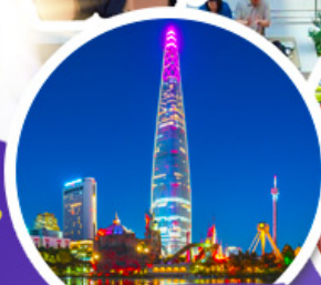
ตึกล็อดเวิลด์

• ช้อปบิง 6 แบนด์ดัง POP Mart / Carlyn / Stand Oil / Emis / Marithe / Mardi