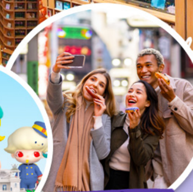
ตลาดเมียงดง