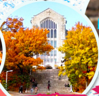
มหาวิทยาลัยอีฮวา