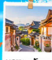
มูกซอนฮันอก