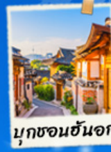
มุกซอนอันอก