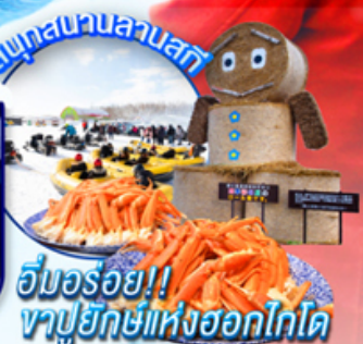
อึ้นอร่อย!! ภูเขาหิมะแห่งฮอกไกโด