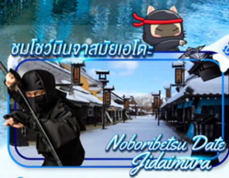
Noboribetsu Date Gidaimura