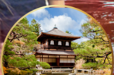
ชมสวนสไตลญี่ปุ่น.. Ginkakuji Temple