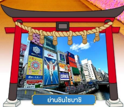
ย่านชินไซบาชิ