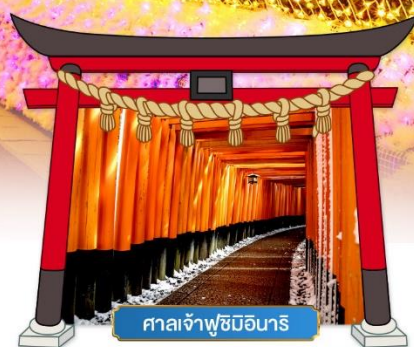
ศาลเจ้าฟูชิมิอินาริ

เดินทางโดยสารการบิน : ไทยแอร์เอเชียเอ็กซ์