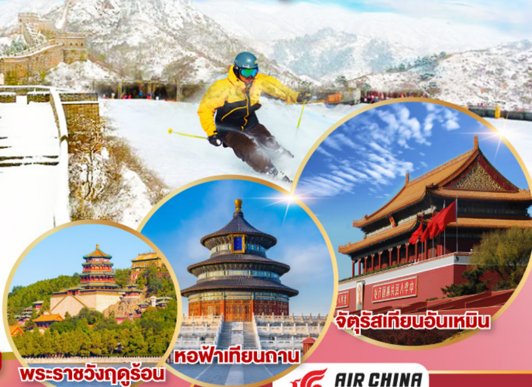
พระราชวังฤดูร้อน

ไปจับ ART TOY ที่ POP MART ไปลงร้านช้อปปิ้ง