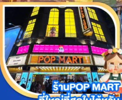
ร้านPOP MART ที่ใหญ่ที่สุดในไต้หวัน