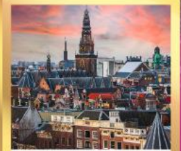
อัมสเตอร์ดัม