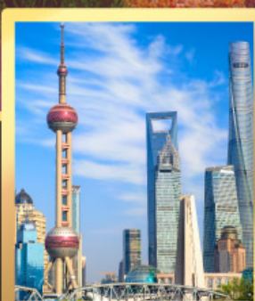
เซี่ยงไฮ้