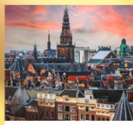
อัมสเตอร์ดัม