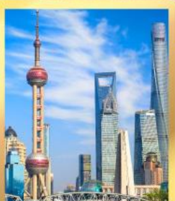
เซี่ยงไฮ้