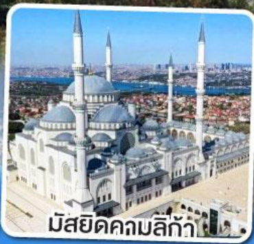
มัสยิดคคมลิทัก้า