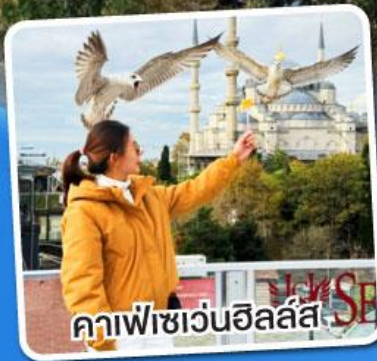
คาเฟ่เซเวนฮิลล์ส์