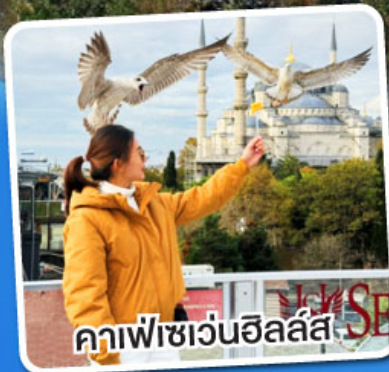
คาเฟ่เซเวนฮิลล์ส

ฟรี!! พวงกุญแจ Evil Eye ชาแอปเปิ้ล, ไอศกรีมมาโก