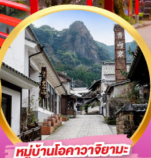
หมู่บ้านโอคาวาจิยามะ