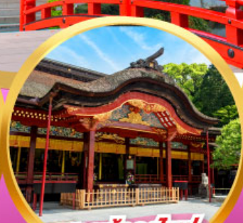
ศาลเจ้าคาโซฟู