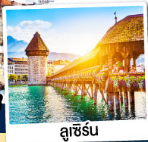
ลูซิิร์น

พิเศษ!! อาบน้ำแร่แช่น้ำอุ่น ณ เมืองลูคอร์เนค เมืองแห่งน้ำแร่สวิตเซอร์แลนด์