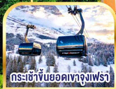
กระเช้าขึ้นยอดเขาจุงเฟรา