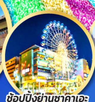
ช้อปปิ้งย่านซากาเอะ