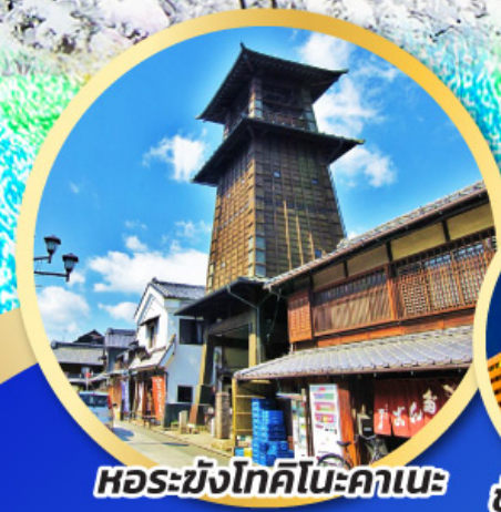
หอรบขังโทคิโนะคาเนะ