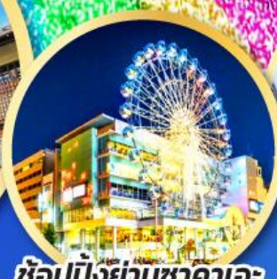
ช้อปปิ้งย่านซากาเอะ