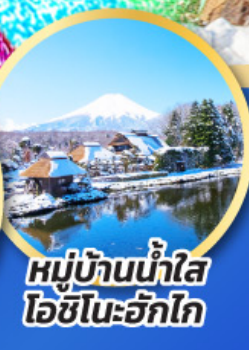
หมู่บ้านน้ำใส ไอชิโนะอัทสึ