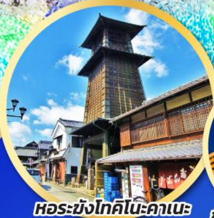
หอรบั้งโทคิโนะคาเนะ