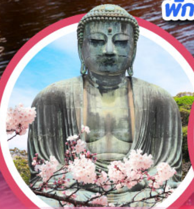
หลวงพ่โต ไดบุตสึ