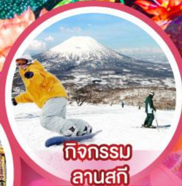
กิจกรรม ลานสกี