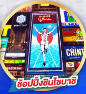
ช้อปปิ้งชินโซบาชิ

เดินทาง 14-19, 21-26 ม.ค. 68 06-11, 13-18 ก.พ. 68 13-18 มี.ค. 68