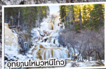
อุทยานโหมวหนี่โกว