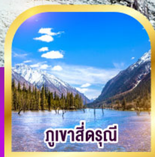
ภูเขาสี่ตระกูล