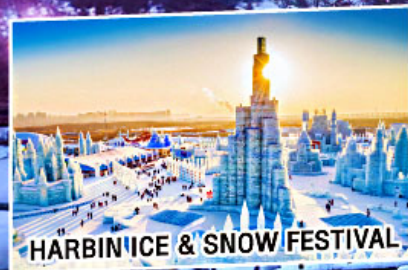
HARBIN ICE & SNOW FESTIVAL