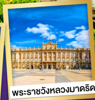
พระราชวังหลวงมาดริด