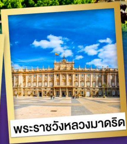
พระราชวังหลวงมาดริด