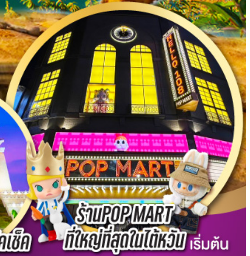
ร้าน POP MART ที่ใหญ่ที่สุดในไต้หวัน เริ่มต้น

เมนูพิเศษ!! ชาบู บุฟเฟ่ต์ ปลาประมานาริบคิ, เสียวหลงเปา