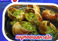
เมนูหอยแอสคาร์โท

ทานอาหาร ณภัตตาคารบนหอไอเฟล พร้อมชมวิวแสนโรแมนติก เมนูหอยแมลงภู่อบไวน์ขาว