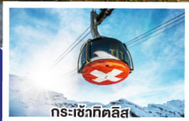
กระเช้าทีคลิส