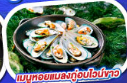
เมนูหอยแมลงภู่อบไวน์ขาว