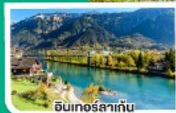
อินเทอร์ลาเก็น