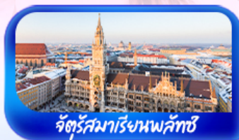
จัตุรัสมาเรียนพลัทซ์