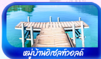
หมู่บ้านอิชเลทวอลด์