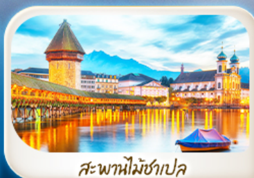
สะพานไม้ชาเปิล