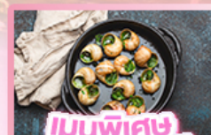
เมนูพิเศษ หอยเอสคาโท

เยอรมัน เนเธอร์แลนด์ เบลเยียม ฝรั่งเศส Keukenhof