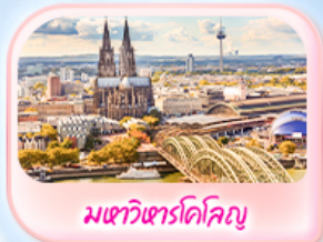
มทาวีซาร์โคโลญ